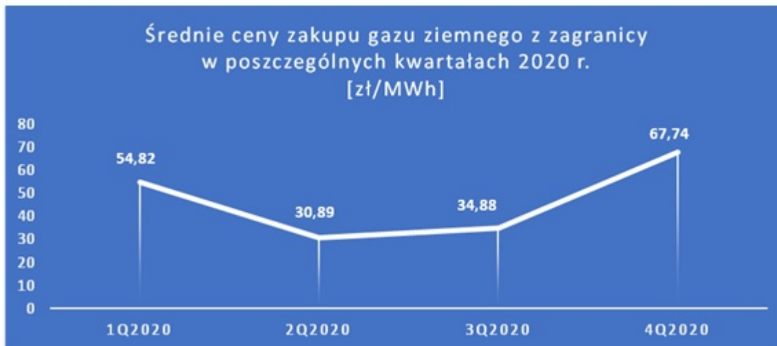
Rys. 1. Średnie ceny zakupu gazu ziemnego z zagranicy w poszczególnych kwartałach 2020 r. [zł/MWh]

W 2020 r. w trzech pierwszych kwartałach notowano najniższe ceny gazu (kwartał do kwartału) od 2015 r. W przypadku czwartego kwartału 2020 r. cena wyniosła 67,74 zł/MWh i była jedynie o 2,66 zł wyższa od najniższej ceny za gaz w czwartym kwartale od sześciu lat.