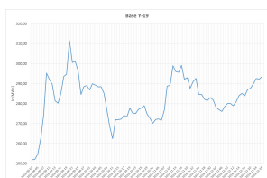
Rys. 1. Ceny instrumentu BASE_Y-19 w okresie wrzesień - grudzień 2018 r. notowanego na TGE

CDS[3] uzyskany na produkcie BASE_Y-19 wynikający z transakcji zawartych w okresie wrzesień - grudzień 2018 r. był dwukrotnie wyższy niż CDS uzyskiwany w przeszłości na produktach BASE_Y-14, BASE_Y-15, BASE_Y-16, BASE_Y-17 i BASE_Y-18 oraz BASE_Y-19 (w okresie od rozpoczęcia notowań w 2016 r. do końca sierpnia 2018 r.