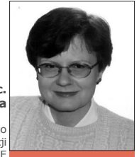
oprac. Małgorzata Szalast-Piwińska

Koordynator Rządowego Programu Przeciwdziałania Korupcji na lata 2018-2020 w URE