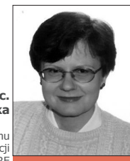
oprac. Małgorzata Szalast-Piwińska

Koordynator Rządowego Programu Przeciwdziałania Korupcji na lata 2014-2019 w URE